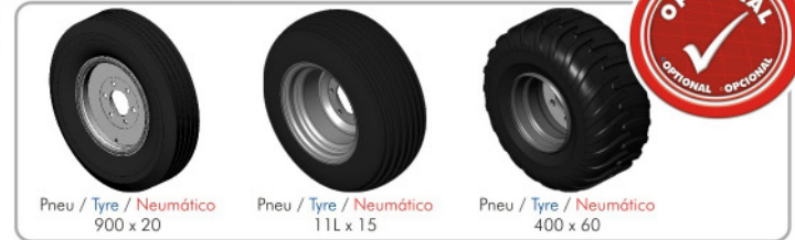
Pneu / Tyre / Neumático 900 x 20 Pneu / Tyre / Neumático 11L x 15 Pneu / Tyre / Neumático 400 x 60

•Standard: Rodeiro duplo com pneu 7.50x16 para os modelos CRSG 32 a 48 discos. •Standard: double ground wheel with tyre 7.50x16 for models CRSG from 32 to 48 blades. •Standard: Ruedas dobles con neumáticos 7.50x16 para los modelos CRSG 32 - 48 discos.